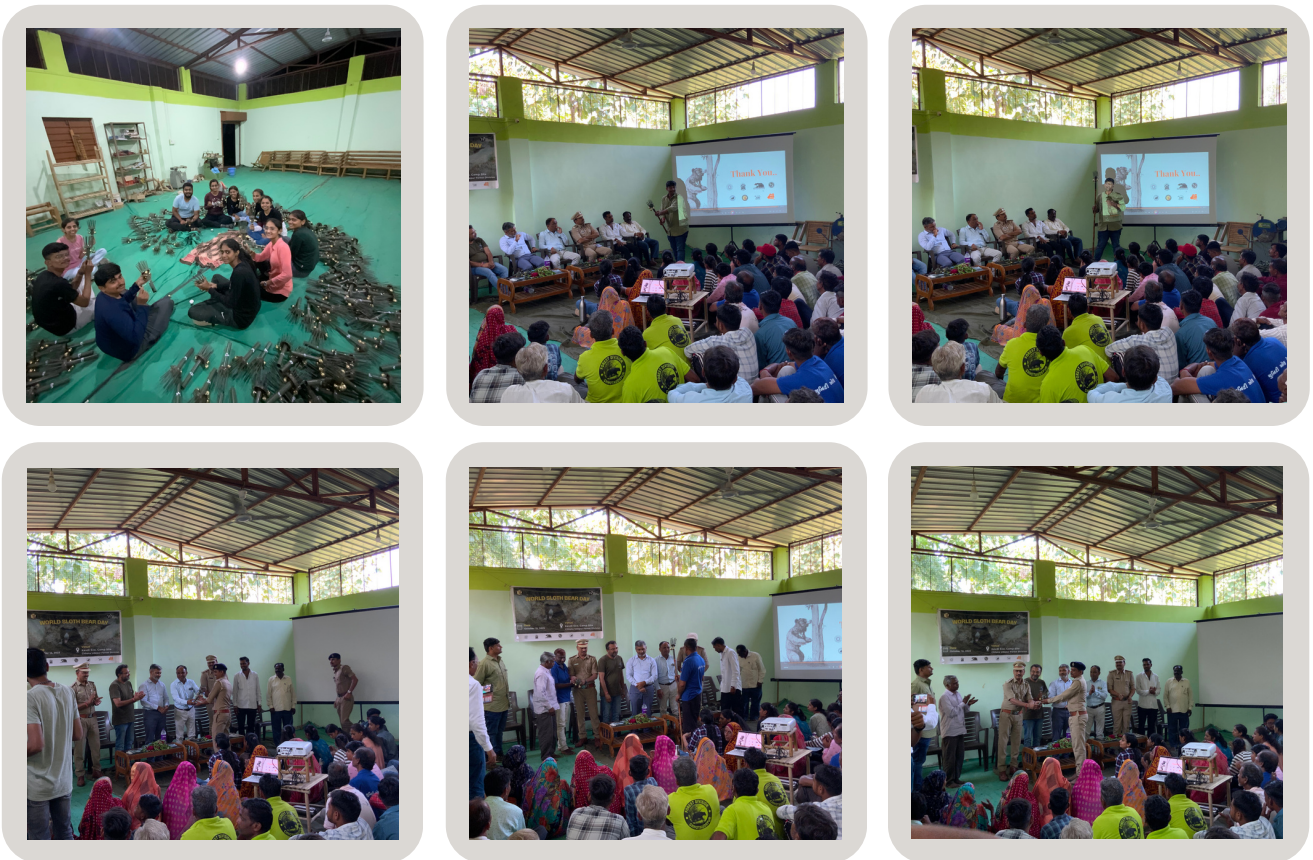
Distribution of bear deterrent stick “Ghanti Kathi” among the frontline field staff and villagers