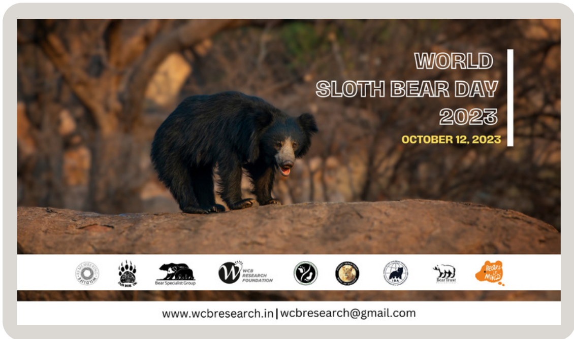
A short video of Team Sloth bear of WCB Research Foundation