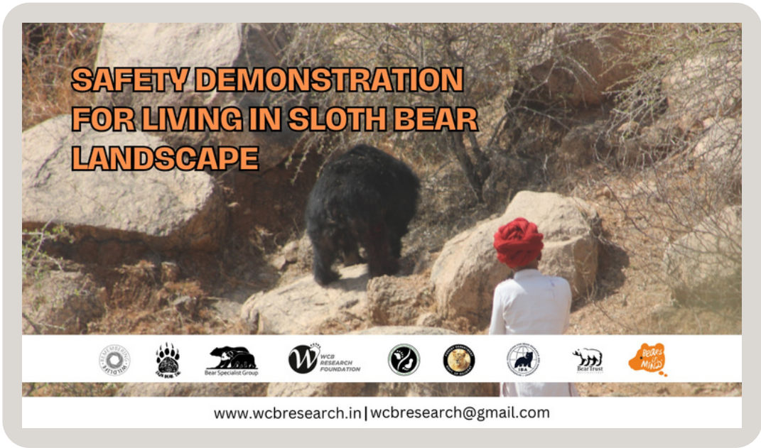
A short video on sloth bear safety education