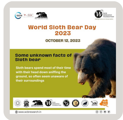
Different slides about Sloth bear facts